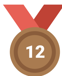
Palettes de bronze